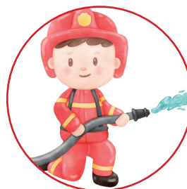
Yohan LEGROS Sapeur Pompier Volontaire Régulation SAMU