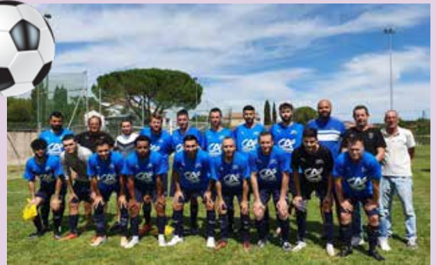
Équipe Senior 1ère