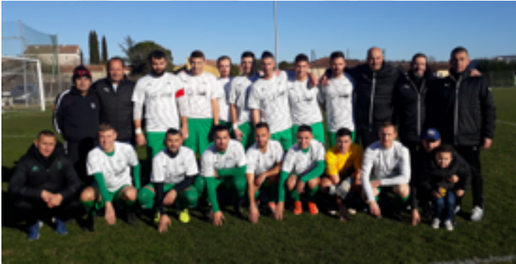
Entente Sportive Cruviers-Vézénobres, équipe 1ère