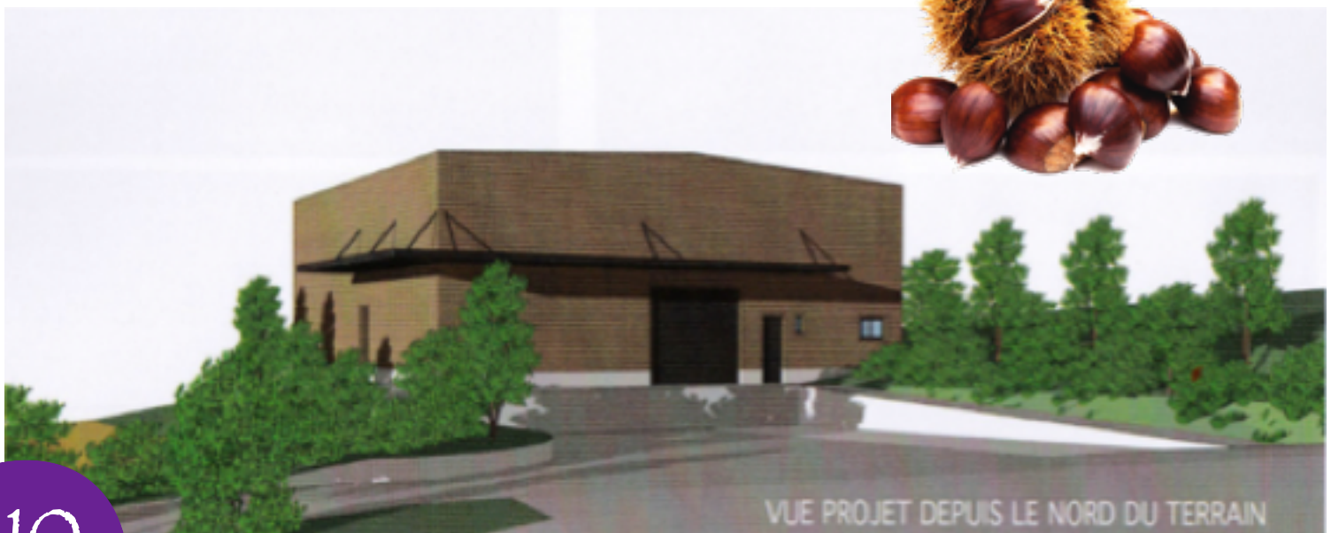
VUE PROJET DEPUIS LE NORD DU TERRAIN